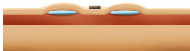
1. Cas figuré de la mise en place de 2 expandeurs de part et d'autre d'une lésion cutanée. Première intervention.

L'expandeur et la valve peuvent être déjà légèrement visibles sous la peau (voussure de la peau).